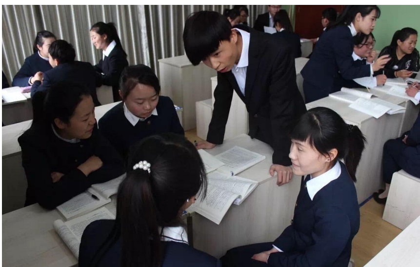
分组讨论社区服务活动策划案