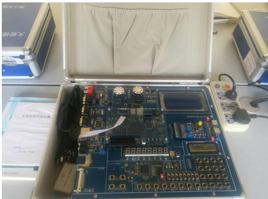
图 7-1 EDA 实训开发系统

EDA 实训开发系统：系统由核心板、系统板构成。核心板采用工业标准多层板设计，既是实验箱的一个组成部分，又可以单独成为一个最小系统开发板，可用于各种创新性实验和科研开发。主芯片采用 Altera 公司 150 万门的 CycloneII 系列中的 EP2C35F672C8。核心板上包含了能满足不同开发需要的 FLASH、SDRAM、高速 clock 和配置芯片以及丰富的外围接口，如串行接口、JTAG 接口、高速 USB 接口、Ethernet 接口、音频接口、电源管理、专用扩展接口等。可以完成目前市场上大多数电子产品的硬件设计及软件开发实验。