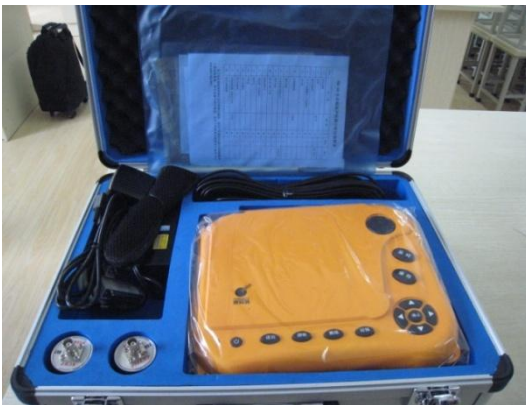
钢筋位置测定仪 KON-RBL (D)