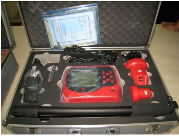
非金属板厚度测测试仪 KON-LBY (B)