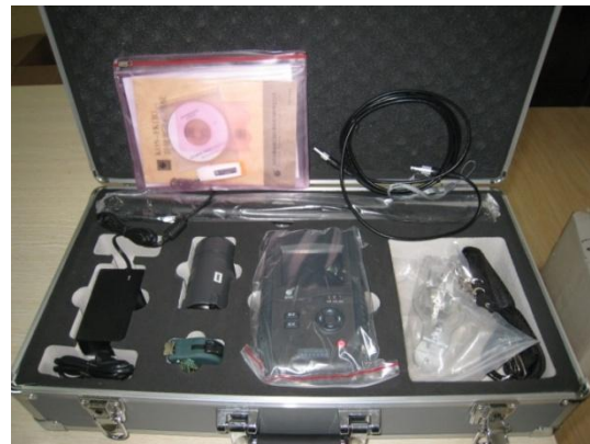
非金属超声检测分析仪 NM-4B