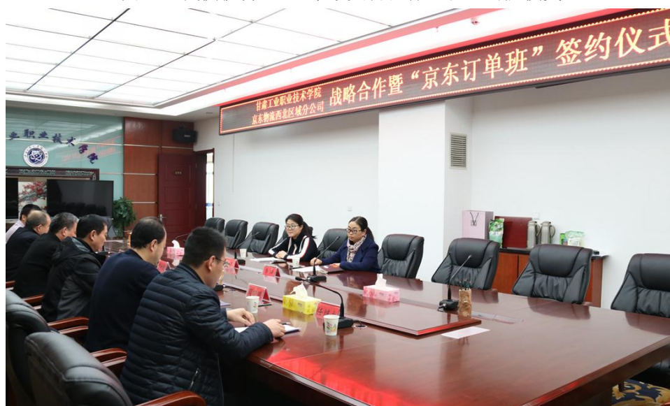
图 8-3 京东订单班签约仪式